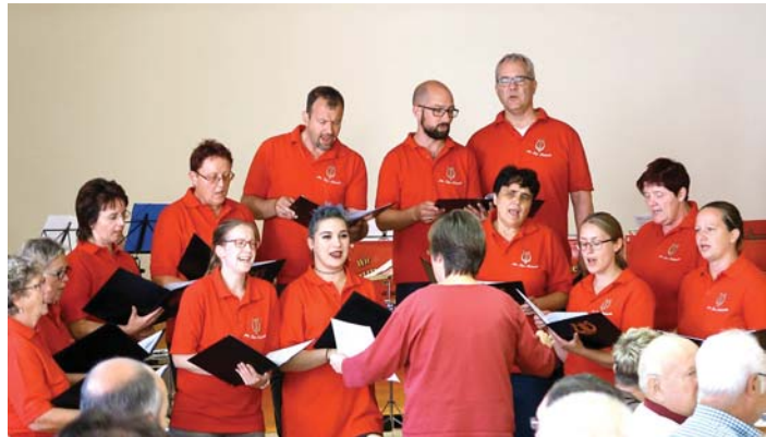
Im Jahr 1928 als reiner Männerchor gegründet, besteht der Gemischte Chor Neuhausen inzwischen aus drei Abteilungen. Dazu zählen der »Gemischte Chor« ebenso ...

Die größten Projekte waren komplette Inszenierungen der Musicals »Rebecca« und »Tanz der Vampire«.