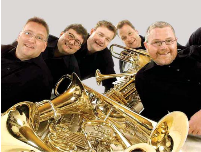
Das »Mannheim Brass Quintett« konzertiert auf Einladung der Stubengesellschaft Engen am kommenden Sonntag, 15. April, um 19 Uhr im Städtischen Museum Engen.