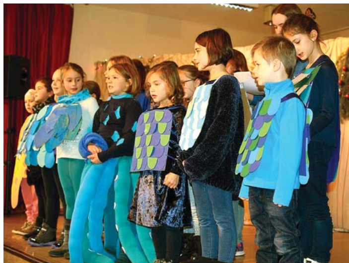
... und der »Kinderchor«, der immer wieder mit Kindermusicals begeistert.