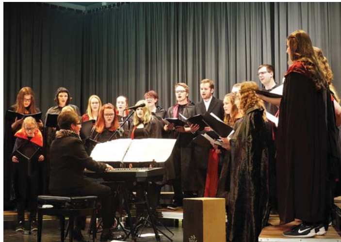
... wie der »Jugendchor«, der von Pop/Rock über Musical-Melodien bis zu Weihnachtsliedern alles singt, was gefällt und Spaß macht, ...